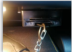
Chip-Schlüssel in der Steckvorrichtung