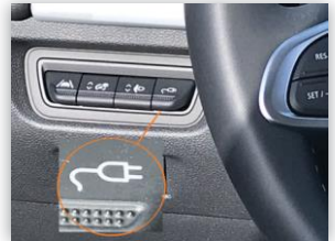
(1) Taste zum Entriegeln des Ladekabels am Auto