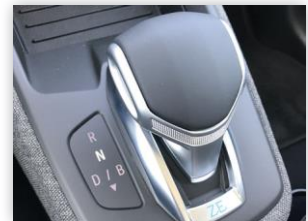
(3) Wahlhebel zum Einlegen der Gänge