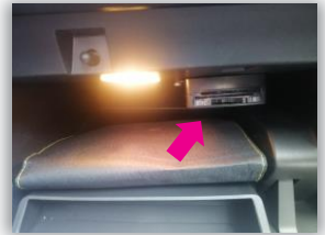
Steckvorrichtung des Chip-Schlüssels