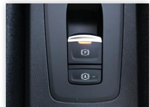
(4) Die Parkbremse löst sich beim Losfahren von selbst.