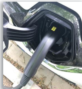
(5) Ladekabel in das Fahrzeug einstecken