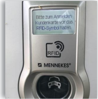
(6) Ladekarte an das RFID-Feld der Ladestation halten