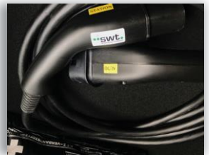
(3) Ladekabel im Kofferraum verstauen