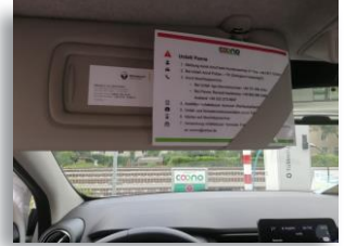
Quickguide hinter der Sonnenblende

Melde dich bei einer Panne oder direkt nach einem Unfall bei unserem Kundenservice und befolge weitere Schritte des Quickguides. Der Quickguide ist hinter der Sonnenblende überhalb des Lenkrads.