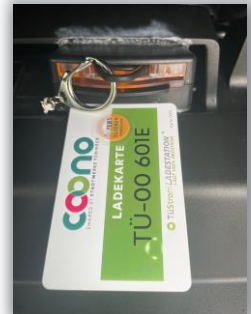
Ladekarte und Steckvorrichtung

Die Ladekarte findest du in der Halterung im Handschuhfach. Achte darauf vor Mietende die Ladekarte wieder zurück in die Halterung zu stecken, sonst kannst du die Miete nicht beenden.