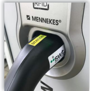
(7) Ladekabel mit etwas Druck in die Ladestation stecken